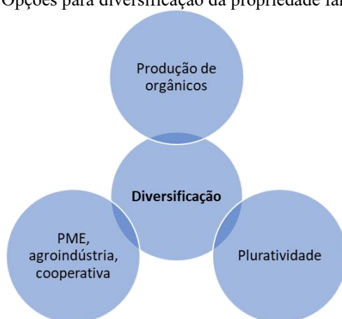
Figura 1 – Opções para diversificação da propriedade familiar.