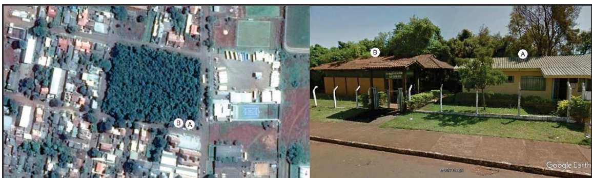
Figura 4. Imagem de satélite da Estação Ecológica Diva Aparecida Camargo (Google Earth®): (A) – Visão parcial da sala de atendimento e (B) espaço laboratorial.

A Estação funciona de segunda a sexta em dois períodos, manhã e tarde, contando com uma sala para atendimento aos visitantes (Figura 4 - A), um escritório, cozinha e uma sala laboratorial (Figura 4 - B). A Unespar disponibiliza um agente universitário para o atendimento ao público e monitoramento dos acadêmicos que realizam atividades de estágio/extensão. É importante mencionar que, em muitos casos, os visitantes, principalmente os da Educação Básica, são orientados por estagiários do Curso, fato que proporciona a vivência da prática pedagógica.