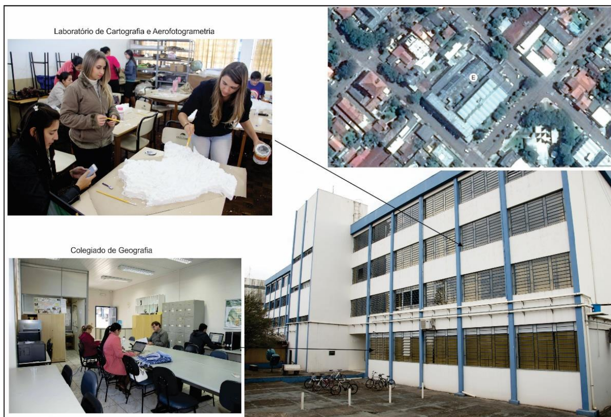
Figura 1. Localização e fotografia de visão parcial dos espaços exclusivos para o Curso de Geografia no Bloco E da Universidade Estadual do Paraná/Campus de Campo Mourão.

O Laboratório propicia o contato dos acadêmicos com equipamentos como receptor GPS, bússolas e estereoscópio de lente, curvímetro, e outros materiais para desenho cartográfico.