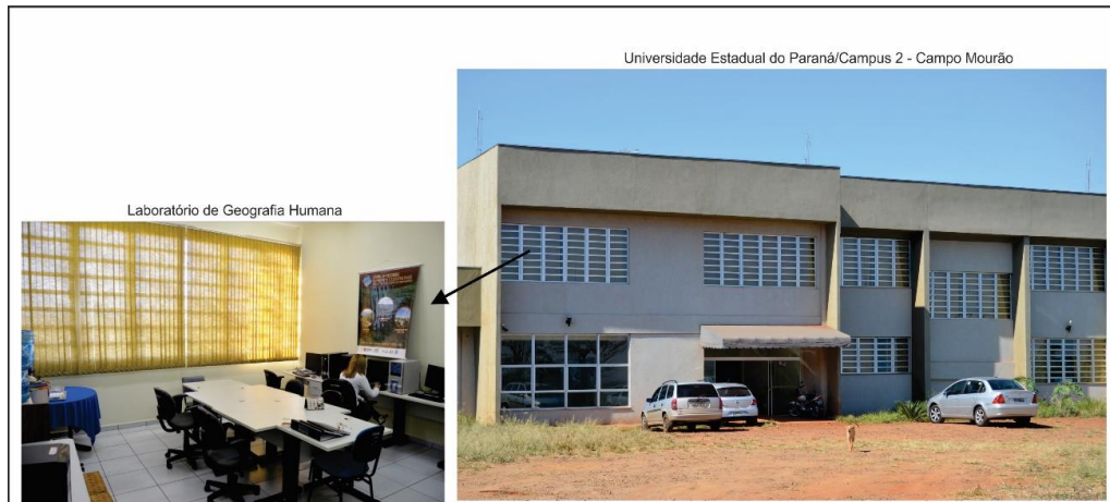
Figura 6. Vista parcial das instalações do Lageoh e do Campus 2 da Universidade Estadual do Paraná.