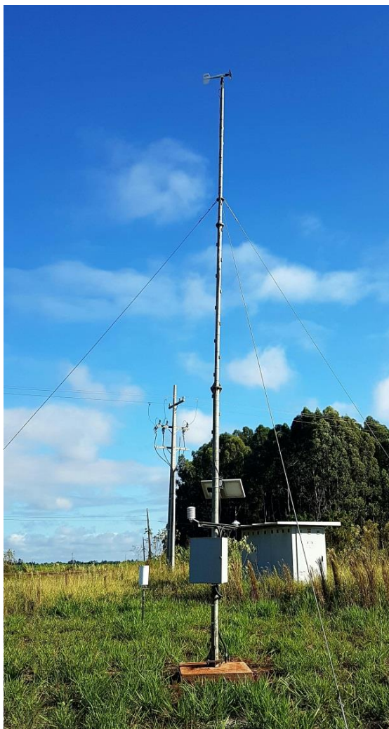
Figura 5. Estação Climatológica automática instalada na Universidade Estadual do Paraná/Campus 2 – Campo Mourão.