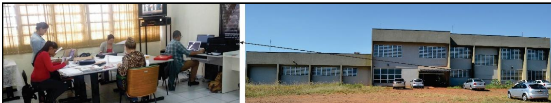
Figura 7 – Vista parcial das instalações do Cinespar e do Campus 2 da Universidade Estadual do Paraná.

Programadora Brasil do Ministério da Cultura (Mic), 825 títulos; c) e com a Kinoforum, 500 títulos.