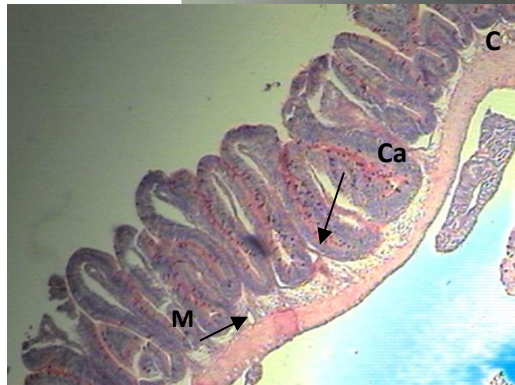
Figura 2. Em A 0%; B 1%, C 2%, D 3% de mananoligossacarídeo (MOS) na dieta. Observar a integridade da altura das vilosidades intestinais em B e C. Destacando as vilosidades (VC) em B, muscular da mucosa (M), e célula caliciforme (Ca) em C. Coloração PAS. Barra 200µ.